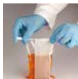
沿著袋身將金屬線往下摺，製造出真空、防漏的空間。