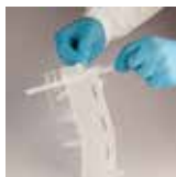
沿著虛線撕開開口。