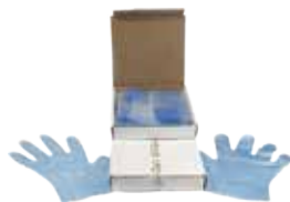
Sterile Blue Gloves