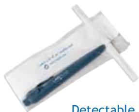
Detectable Blue Pen