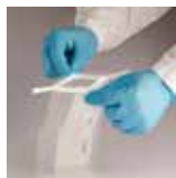
利用拉帶拉開檢體袋。