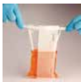
運用上緣金屬線拉平檢體袋，並扭轉封緊。